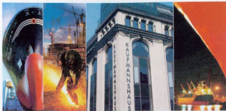
Zu den „Spezialitäten“ von HCI Capital zählen Schiffsbeteiligungen und Immobilienfonds. Mit Aragon soll das Wachstum nun beschleunigt werden.

HCI Capital und Aragon schmieden eine strategische Allianz. Zusammen wollen die Unternehmen den heimischen Finanzmarkt aufrollen.