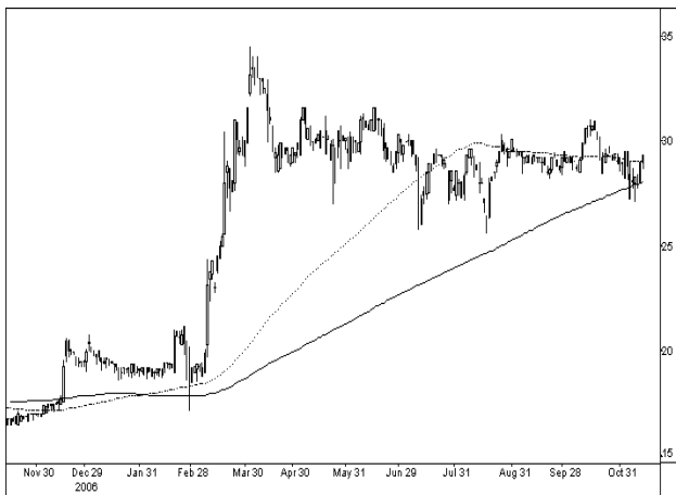
Kursverlauf mit 100-Tage und 200-Tage Linie